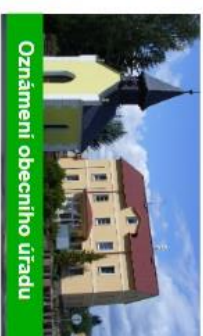
Oznámení obecního úřadu