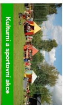
Kulturní a sportovní akce

Přihlášením k odběru hlášení dává registrovaný občan souhlas se zpracováním poskytnutých osobních údajů za účelem zaslání aktuálních informací z obce. Více informací o rozsahu a účelu zpracování a odvolání souhlasu najdete na adrese www.vintrov.hlasenirozhlasu.cz nebo osobně na obecním úřadě.